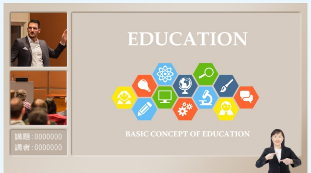
三分割 x 合成手語鏡頭(去藍背景)