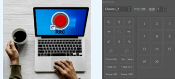
*Remote Rec Controller

可透過網路遠端管控錄播主機 開關機、錄停、場景切換、影音預視(輸出及來源)、 直播金鑰、檔案播放/下載、控PTZ雲台攝影機]