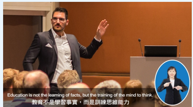
講師全畫面(中英字幕 x 右下遮罩)