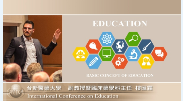
並排版型(講者左右裁切x簡報區x底圖)