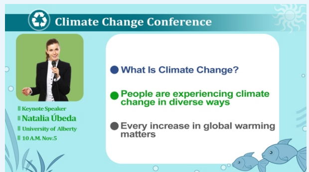
*自製版型:講者及課程資訊(遮罩應用)

* 場景版型可置換顏色底圖(黑白藍)或自製底圖 * 內建傳統 4:3 比例簡報版型(裁減黑邊) * 預設去背場景(置中、左右、子母) **依型號